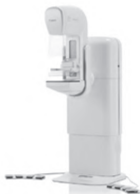
新型マンモグラフィ

だしこりが触れるほど大きくない初期の乳がんで見られる場合があるため、がんの早期発見に非常に重要です。