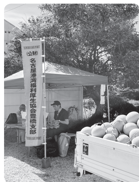
メロン狩り大会の様子

コロナ禍前に比べ若干参加者が減少しましたが、20名の参加者が集まり、改めてメロン狩りの人気を感じた大会となりました。