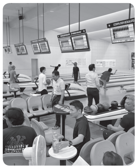
ボウリング大会の様子

猛暑続く中、仕事が終わった後での大会にもかかわらず、会場ではより熱い戦いが行われ、あちこちで豪快にピンの倒れる音とともに歓声が上がリ、仕事とはまた違う真剣な顔を見せ合い、親睦を深めることができました。