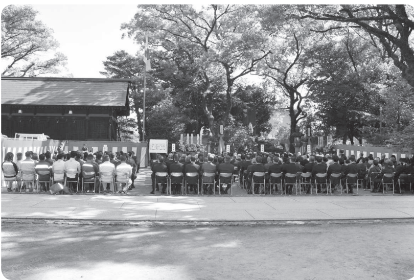
今年の慰霊祭の様子

合理化、機械化がすすめられる現在も、港湾の業務には、危険を伴う作業も少なくなき、誠に残念ではありますが、本年は新たに一柱の合祀が行われました。参列者一同、笙・箏が神々しく奏でられる中、碑中の御霊にご冥福を祈るとともに、業務の安全と事故撲滅を誓い合いました。