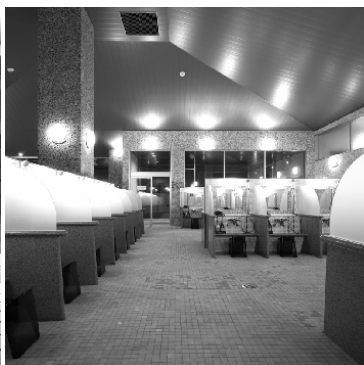
洗い場はゆったり広々です。 身障者優先や親子用もご用意。