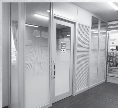
金城福祉センター