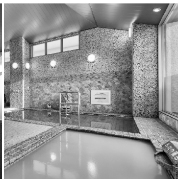
シルク風呂やラジウム風呂、 奥には弱電気風呂とジェットバスも。