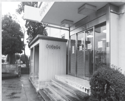
稲永福祉センター