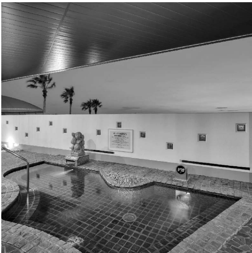
ガーデン炭酸風呂からは三河湾の眺望もお楽しみいただけます。ゆっくりお風呂に浸かってリフレッシュ。