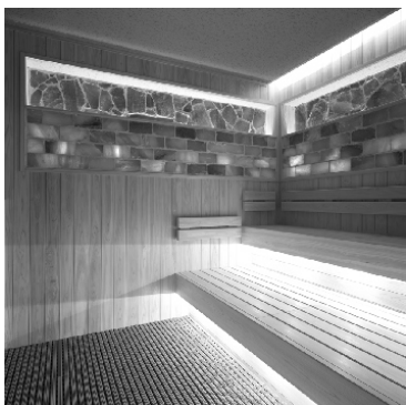
岩塩のブロックが壁面に貼られた サウナ。