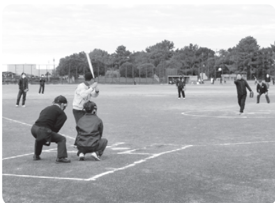
ソフトボール大会の様子