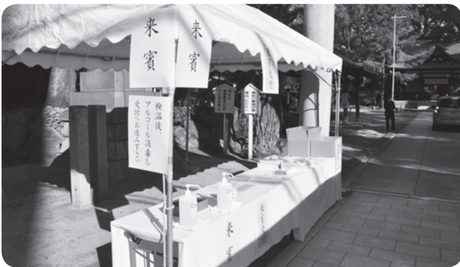
手指消毒用アルコールの設置

合理化、機械化がすすめられる現在も、港湾の業務には、危険を伴う作業も少なくなく、参列者一同、笙・篳篥が神々しく奏でられる中、碑中の御霊にご冥福を祈るとともに、業務の安全と事故撲滅を誓いました。