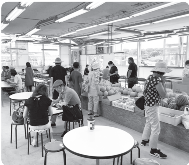
メロン狩り大会の様子

そんなコロナ禍ではありますが、ほぼ例年並みの264名の方にご参加頂き、メロンの人気を改めて感じる大会となりました。