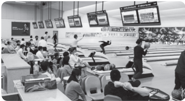
ボウリング大会の様子

当日は一人2ゲームの個人戦で、50名の参加者が競い合いながら、親睦を深めました。