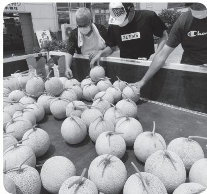
メロン狩り大会の様子

コロナ禍の影響から参加者の大幅な減少を心配しましたが、ほぼ予定通りの212名の参加があり、メロンの人気を改めて感じる大会になりました。