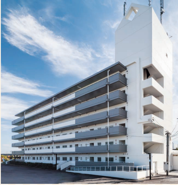
改修工事後の鴨浦住宅

したが、設計会社と相談しカラーパターンを入れました。居住者からは綺麗になった等の感謝の言葉をいただいております。