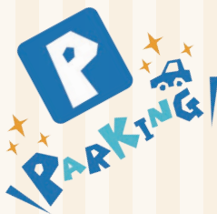
名港福会館関係者専用駐車場出入口