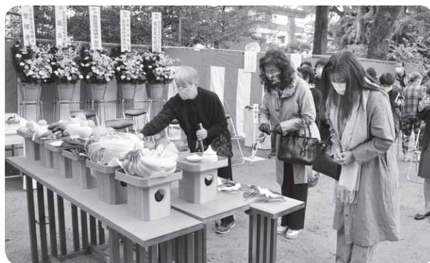
ご遺族による玉串奉奠