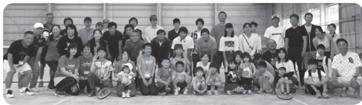
テニス&バーベキュー大会集合写真

5月12日(日) 衣浦マリントンテニスクラブにおいて、テニス&バーベキュー大会を開催しました。