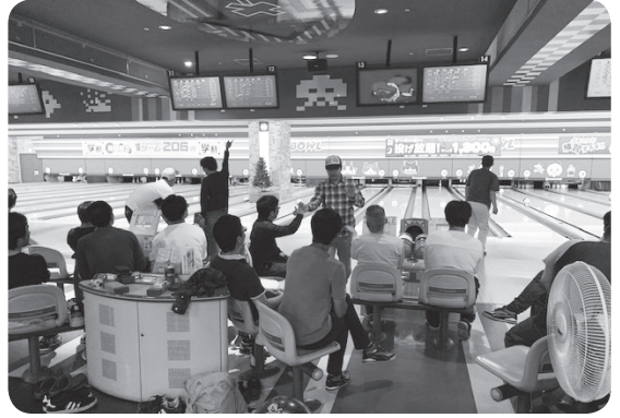
ボウリング大会の様子