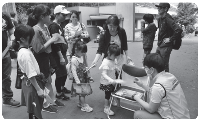
スタンプラリーの様子

東山動植物園は、広大な敷地にメダカからゾウまで動物が約500種類と、植物が約7000種を展示しており、ウォーキング&スタンプラリーには最適な場所でした。参加者の皆様に喜んでいただけるようにお弁当は天むす、小学生未満のお子様にはお菓子を用意しました。