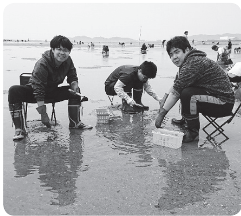
潮干狩り大会の様子

参加者は、小さくても大きなあさりが出てきた時には嬉しそうな声を上げていました。楽しい一日となりました。